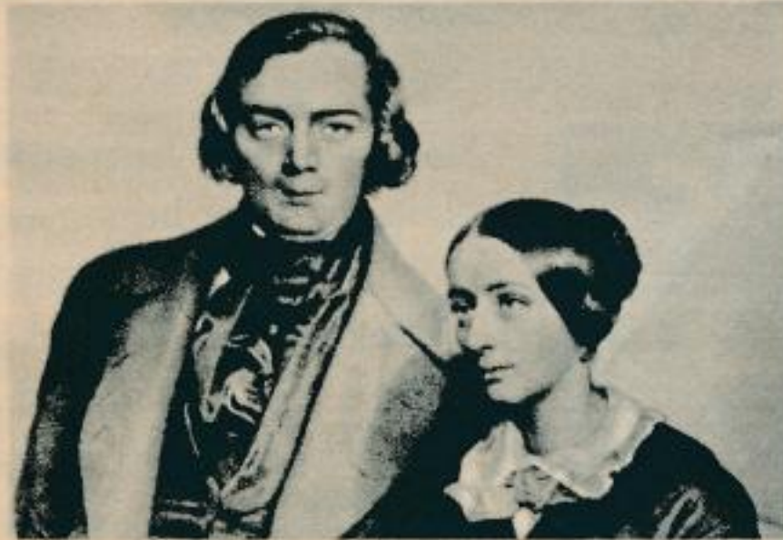
Robert und Clara Schumann nach einem Gemälde von Kayser (1847)

Der Freundes- und Verehrerkreis der Meisterwerke klassischer Musik findet von jeher im großen TEF-Schallbandrepertoire besonders exquisite Aufnahmen dieses Musikgebietes. Da Solisten, Dirigenten und Orchester dieser Aufnahmen von der Presse des In- und Auslandes immer wieder in Wort und Bild gewürdigt werden, haben wir für die Illustration dieser Sonderseite seltene Komponisten-Zeichnungen ausgewählt. Wir würden uns freuen, wenn Ihnen, liebe Freunde der klassischen Musik, diese Darstellungen die adäquate Atmosphäre zur Auswahl der Ihnen zusagenden Schallband-Titel vermitteln würde.