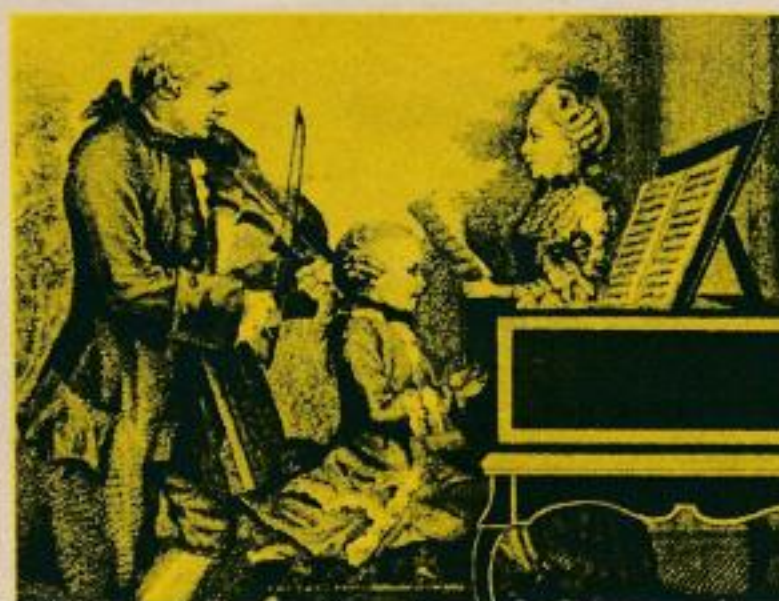
Der junge Mozart, zeitgenössische Zeichnung.

Durch Überreichung derartiger Visitenkarten (erste Takte seines Vokal-Quartetts „Der Gruß“) hielt sich der alte Haydn unliebsame Besucher fern.