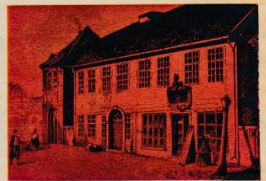
Carl Maria von Webers Geburtshaus in Eutin.

Durch Überreichung derartiger Visitenkarten (erste Takte seines Vokal-Quartetts „Der Gruß“) hielt sich der alte Haydn unliebsame Besucher fern.