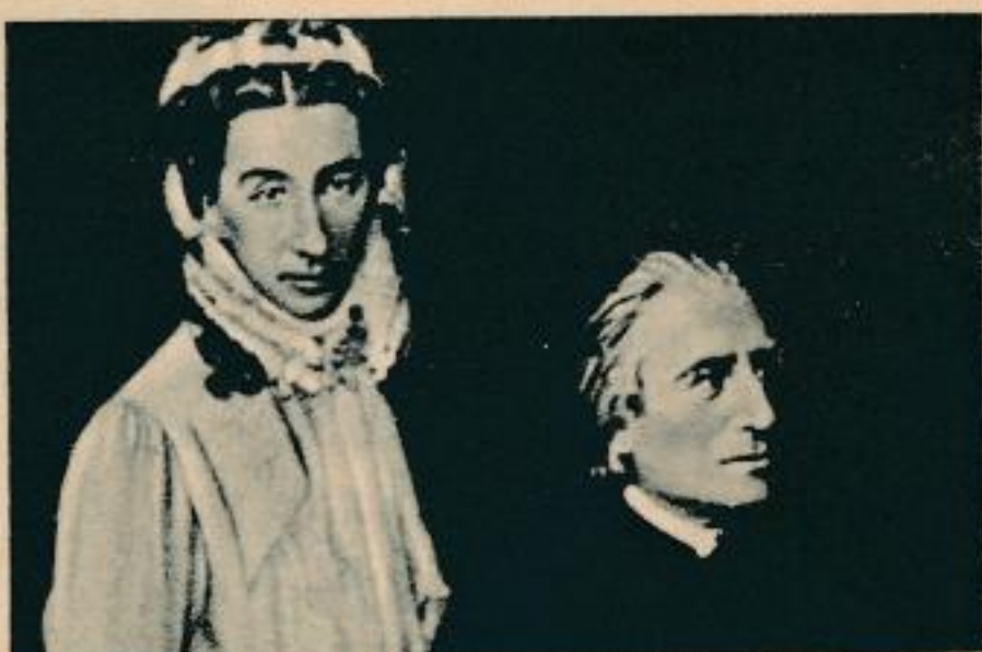
Franz Liszt mit seiner Tochter Cosima.