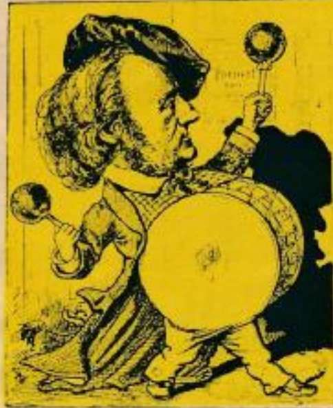
Bum, Bum! Das Bombardement von Bayreuth geht los. Aus d. „Wiener humorist. Blättern“, 1882.

Der Freundes- und Verehrerkreis der Meisterwerke klassischer Musik findet von jeher im großen TEF-Schallbandrepertoire besonders exquisite Aufnahmen dieses Musikgebietes. Da Solisten, Dirigenten und Orchester dieser Aufnahmen von der Presse des In- und Auslandes immer wieder in Wort und Bild gewürdigt werden, haben wir für die Illustration dieser Sonderseite seltene Komponisten-Zeichnungen ausgewählt. Wir würden uns freuen, wenn Ihnen, liebe Freunde der klassischen Musik, diese Darstellungen die adäquate Atmosphäre zur Auswahl der Ihnen zusagenden Schallband-Titel vermitteln würde.