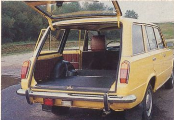
1½ kuub laadruimte