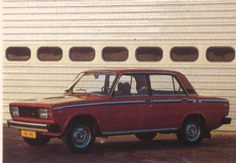
2105 met striping